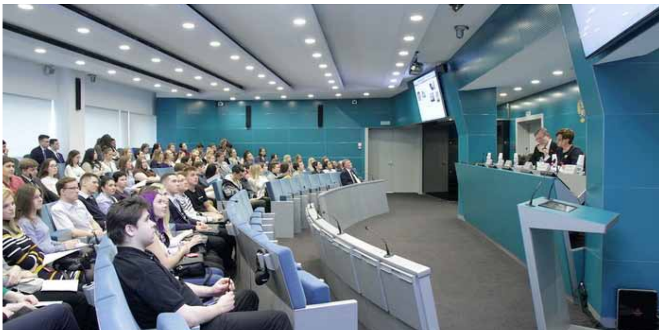
День открытых дверей в ФАС России для студентов московских вузов

других органов государственной власти и управления, общественных объединений предпринимателей, средств массовой информации. Мероприятия проходят в различных форматах и составах участников, вызывают большой интерес со стороны руководителей предприятий, предпринимателей. Так, публичные обсуждения правоприменительной практики ФАС России и Московского УФАС России по итогам 3 кварталов 2017 года 8 прошли 1 декабря в Правительстве Москвы. Со вступительным словом к участникам публичных обсуждений обратился заместитель руководителя ФАС России Сергей Пузыревский. Он рассказал, что Федеральная антимонопольная служба в числе 12 надзорных органов является участником реформы контрольно-надзорной деятельности. Реформа предусматривает как изменение законодательства, так и изменение подходов к контрольным и надзорным процедурам. «ФАС России является активным участником проекта и отмечает, что новая система госконтроля позволит снизить административную нагрузку