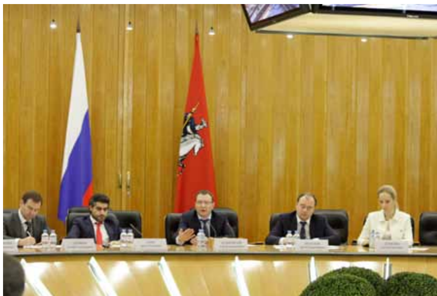
Публичные слушания по правоприменительной практике ФАС России и Московского УФАС России в Правительстве Москвы.