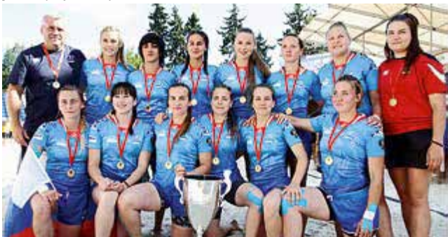
«Дебют года» — Женская сборная России по пляжному регби