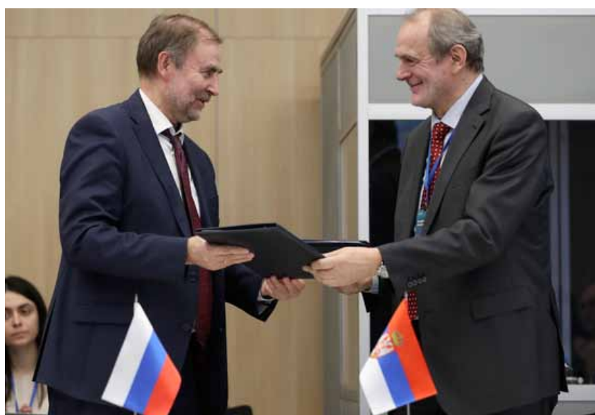
Подписание Меморандума о взаимопонимании в области тарифного регулирования электронной связи и почтовых услуг между ФАС России и Агентством по регулированию электронной связи и почтовых услуг Республики Сербия

Подготовлено Управлением общественных связей ФАС России