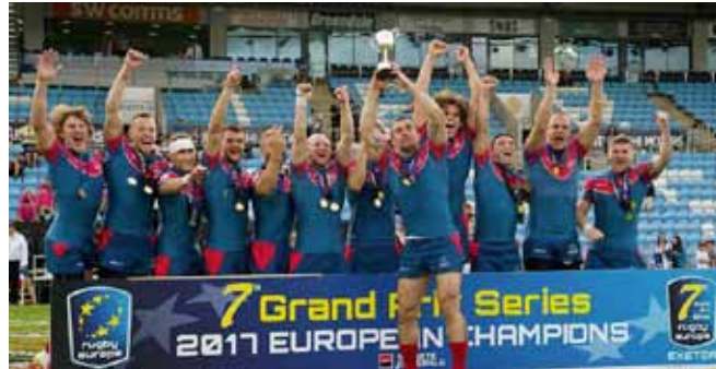
Сборная России по регби-7