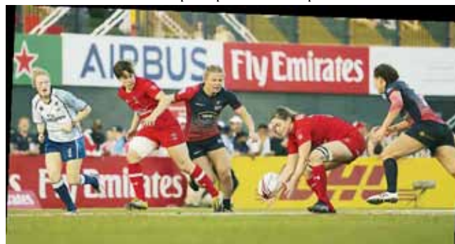
Сборная России по регби-7 в игре