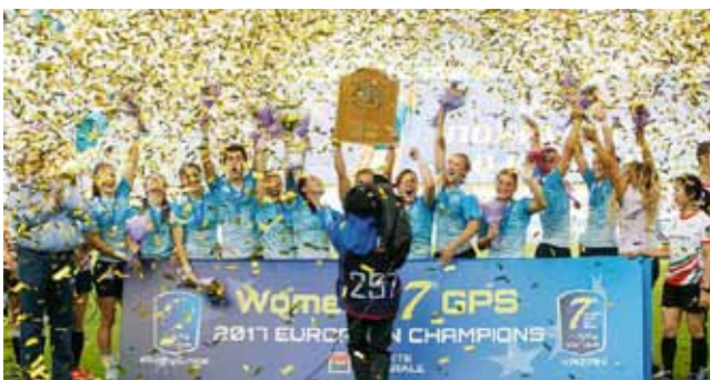
«Команда года» — сборная России по регби-7